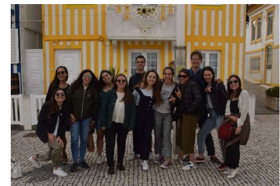
Twinning mit Portugal